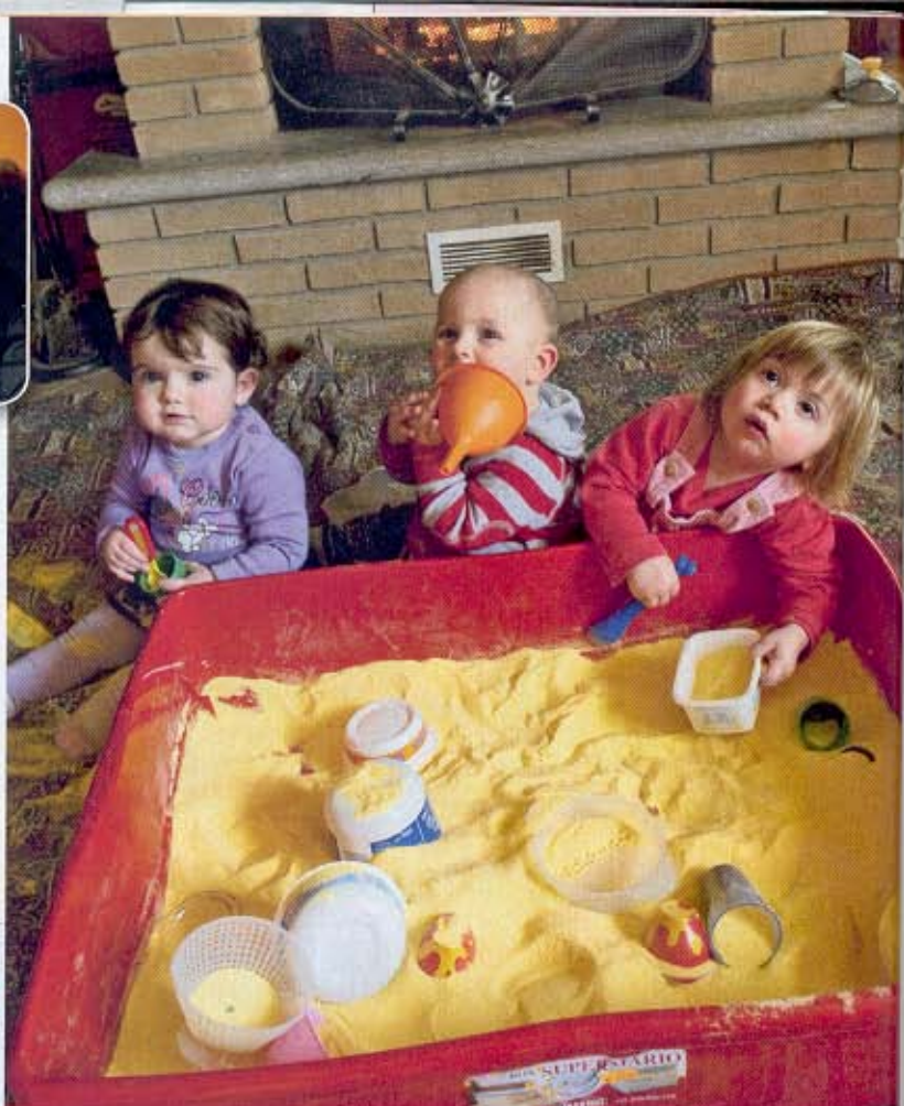
Si gioca con la farina di semola, sembra proprio sabbia