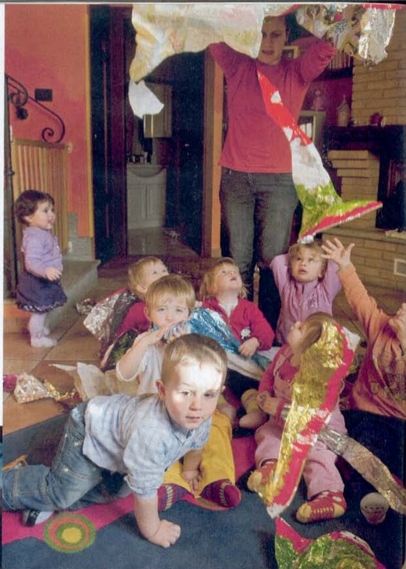
Mamma Federica fa il gioco della pioggia: la carta dell'acquazzone! La "sala giochi" è riservata ai piccoli