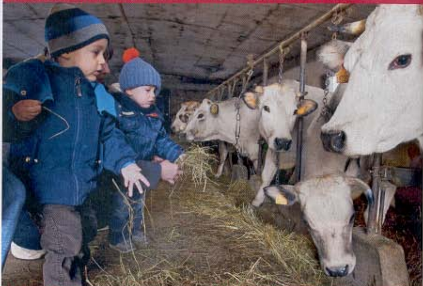
"Andiamo a vedere le mucche!" O a giocare sulla neve...